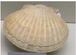
큰가리비 ( )