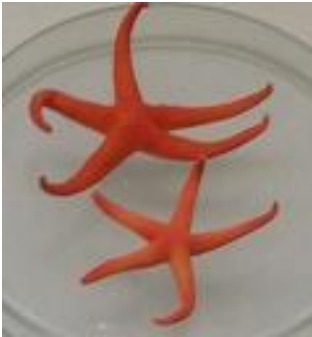
빨강불가사리 ( )