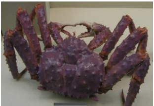
황게 ( )