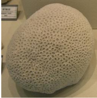
뿔빛돌산호 ( )

식물은 스스로 영양분을 만들어 살아가지만, 동물은 스스로 영양분을 만들지 못해서 다른 것들을 잡아 먹고 살아요. 다음 사진을 보고 동물인지 식물인지 ○로 표시해보세요.